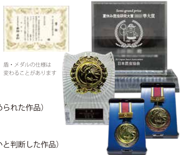
盾・メダルの仕様は 変わることがあります

各賞受賞者には表彰状と副賞が、惜しくも入選を逃した方にも記念品と参加証（小さな表彰状）が贈られます。